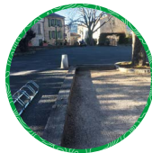
Saint-Paul-en-Forêt Place du champ de Foire