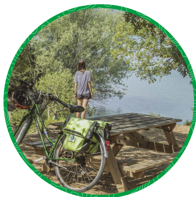
Saint-Paul-en-Forêt Lac du Rioutard - Lac de Méaulx