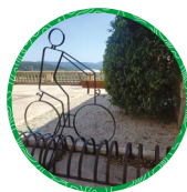
Montauroux Place du Clos