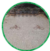
Tanneron Maison du Lac de Saint-Cassien