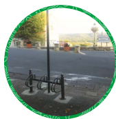
Fayence Place Léon Roux